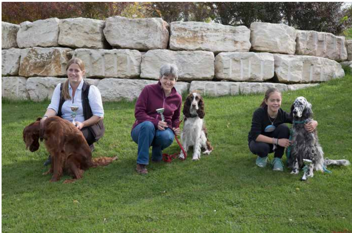
Sieger Herbstprüfung 2017, Fortgeschrittene Prüfung