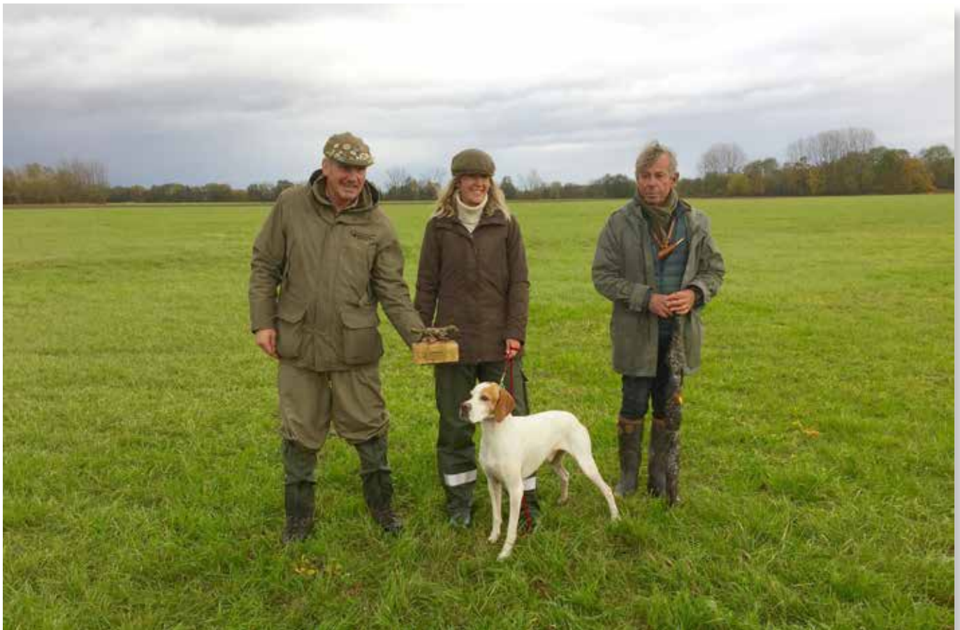
Gewinner Wanderpreis Kogenheim, Sirius