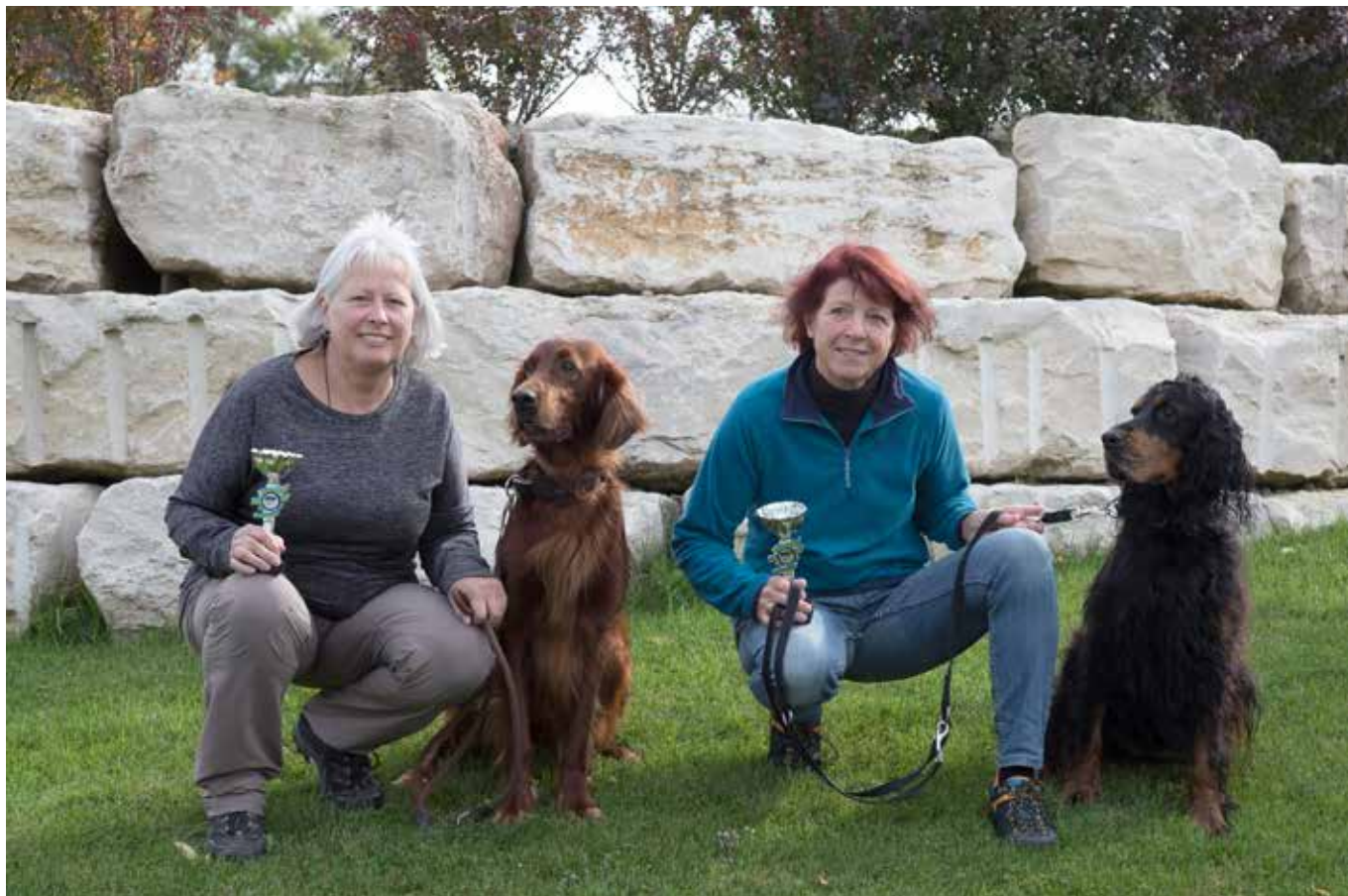
Sieger Herbstprüfung 2017, Apport II Prüfung