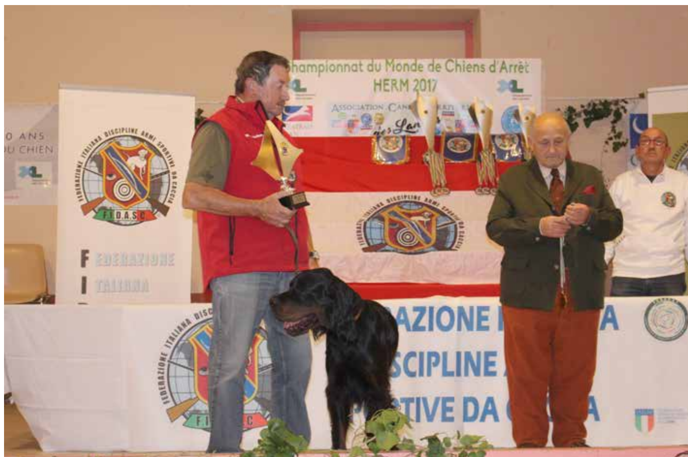
Mediterranean Cup 2. Place Fidelio du Clos de la Capitainerie