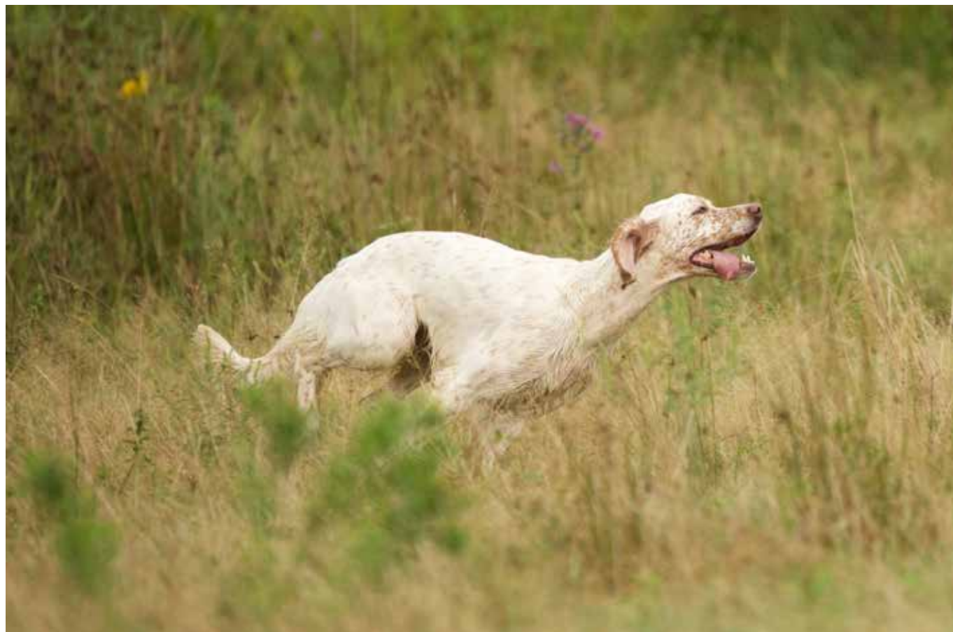
Vizeeuropmeisterin GT 2017, Duchesse du Tourbillion blanc