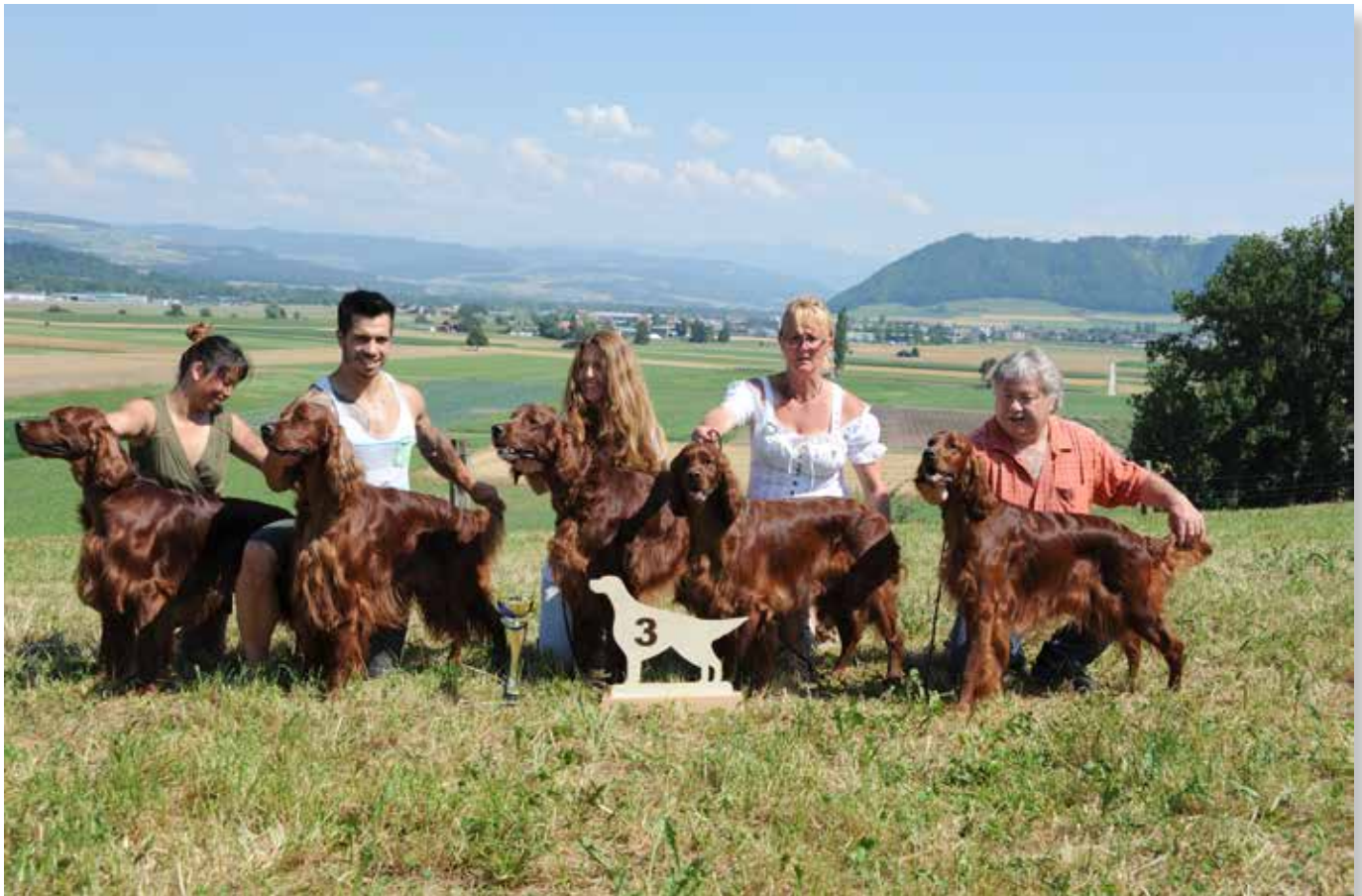
Zuchtgruppe 3. Rang