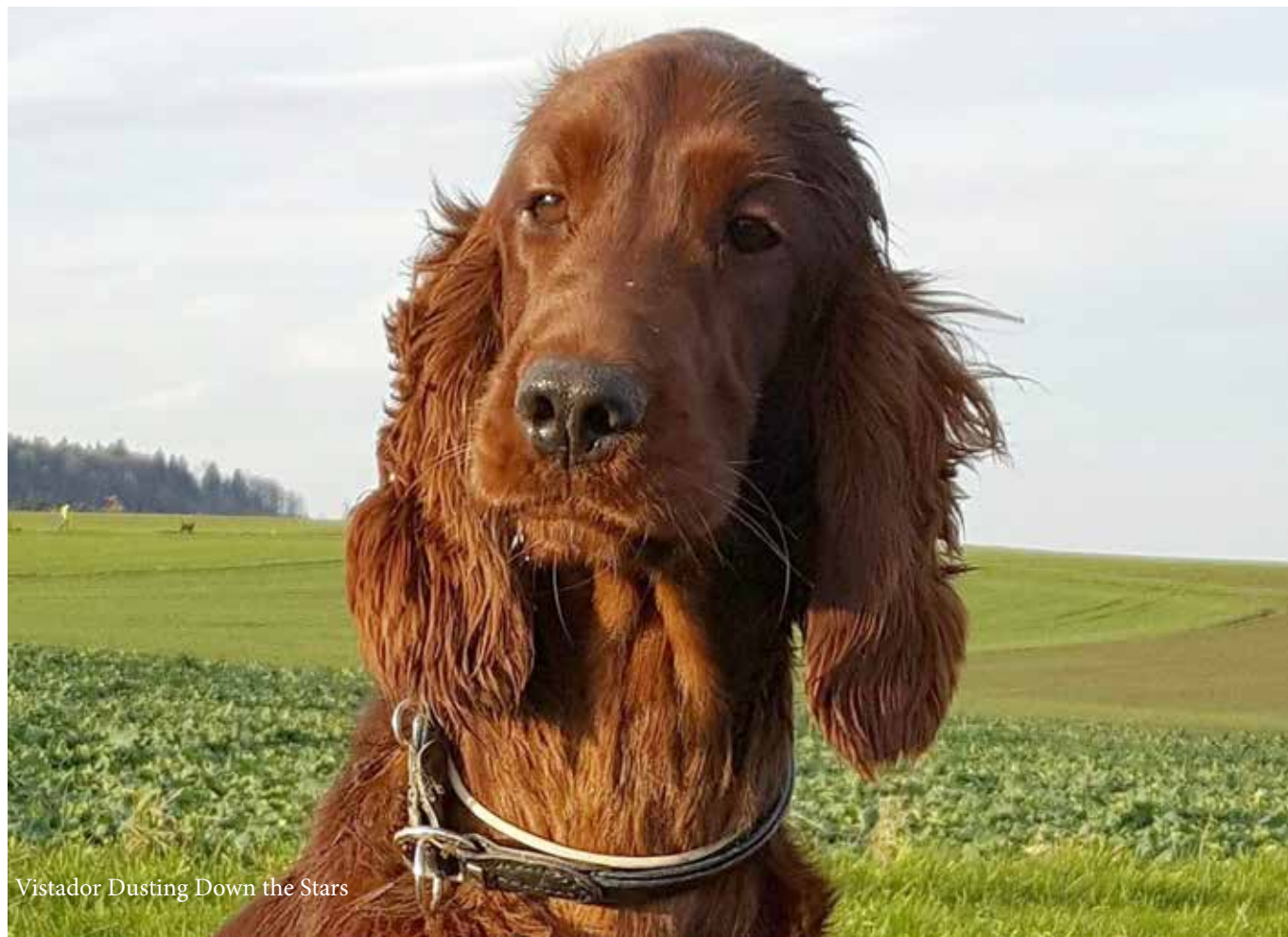
Vistador Dusting Down the Stars