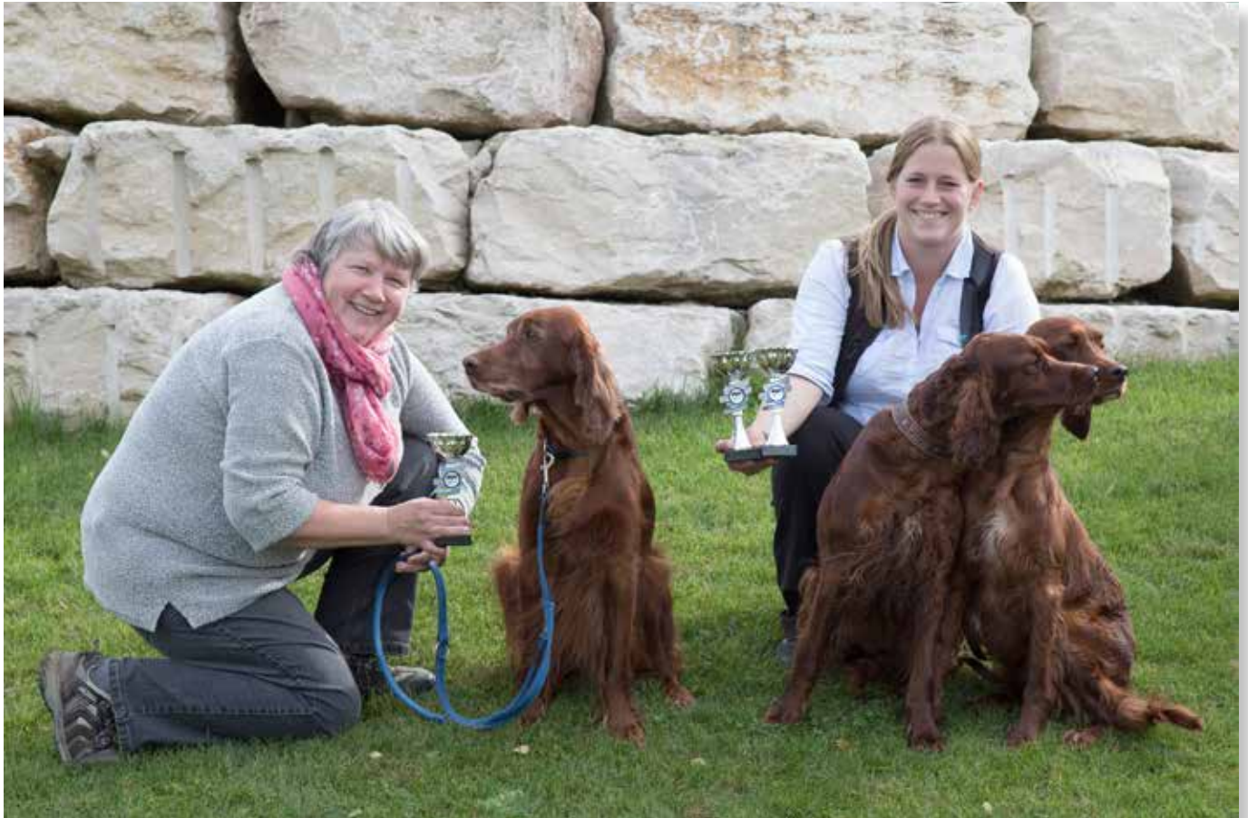
Sieger Herbstprüfung 2017, Beginner Prüfung