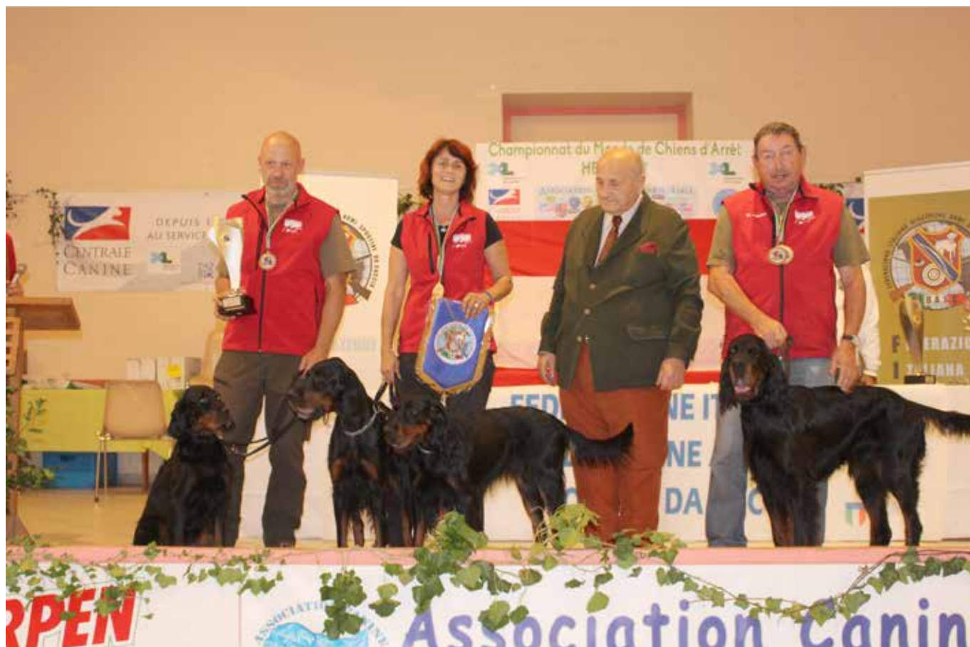
Mediterranean Cup the Swiss team wins 3.