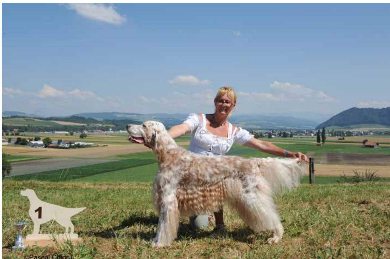
Tagessieger Veteran Fairray Countdown