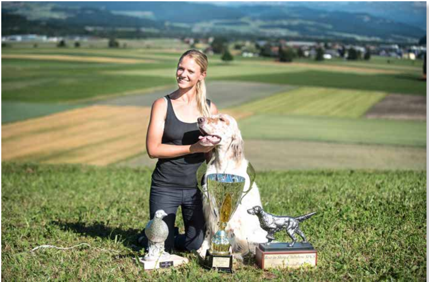
Best in Show 2017 Jet Agent Jethro von der Guldegg