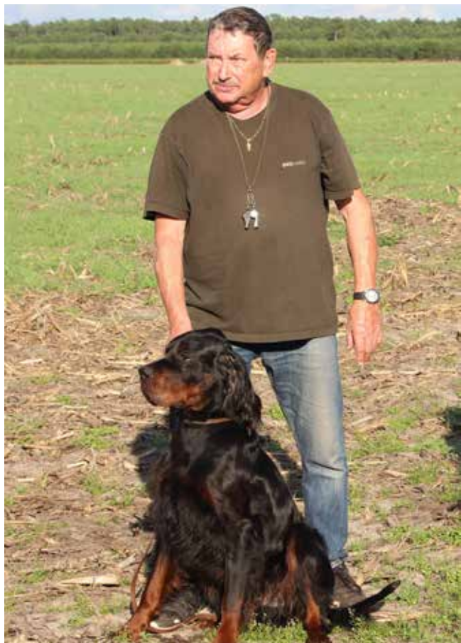
Europameister GT 2017, Fidelio du Clos de la Capitanerie