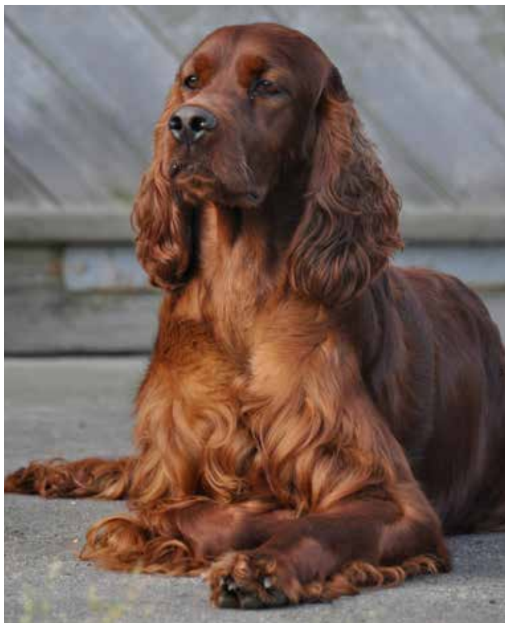
Eireann's Sprite Celebration