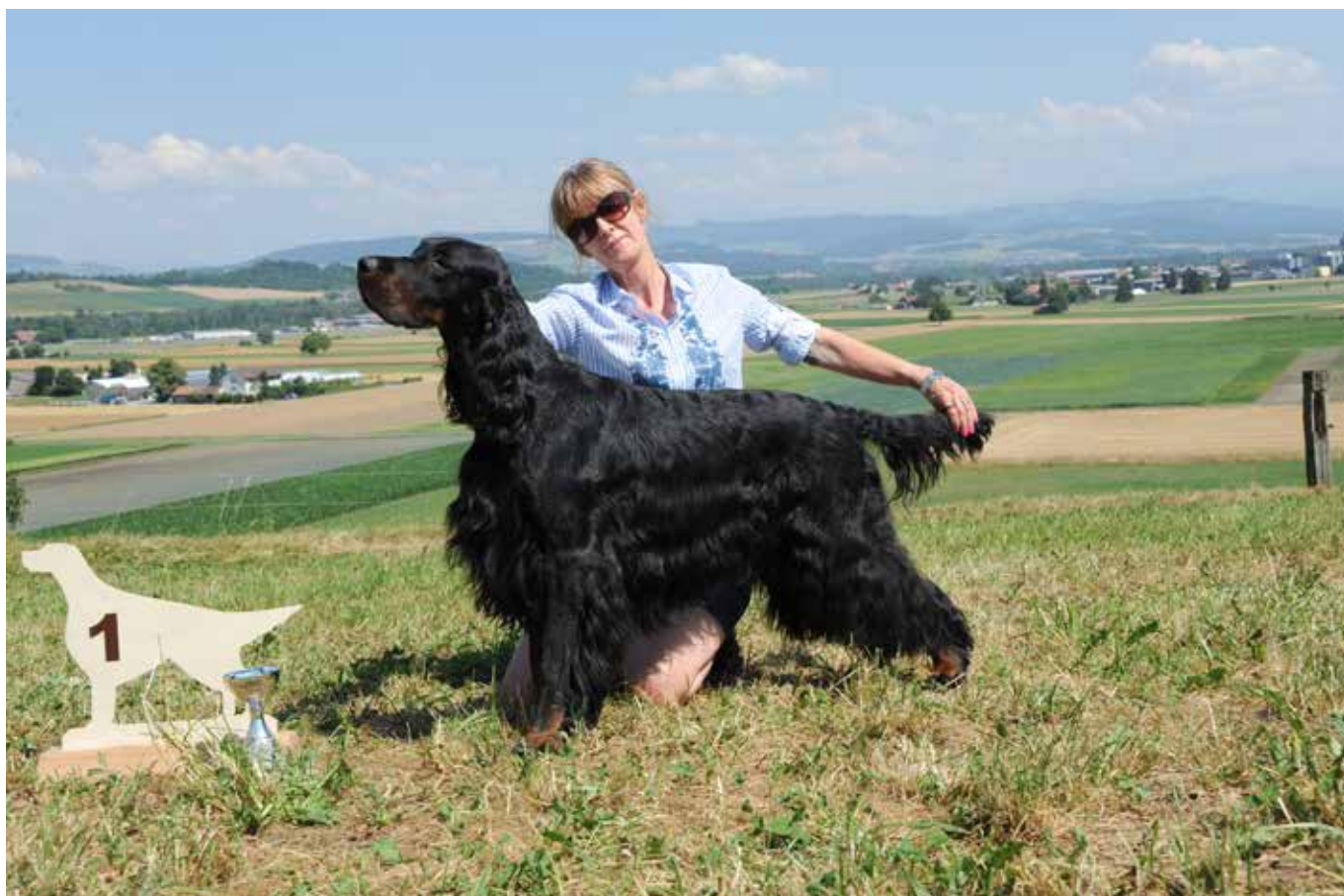
Tagessieger Gebrauchshunde Black Mystery Prince of Gordon