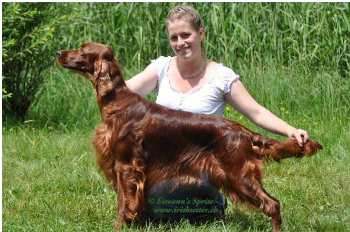
Lovehazel of the Trav'Lin Starl