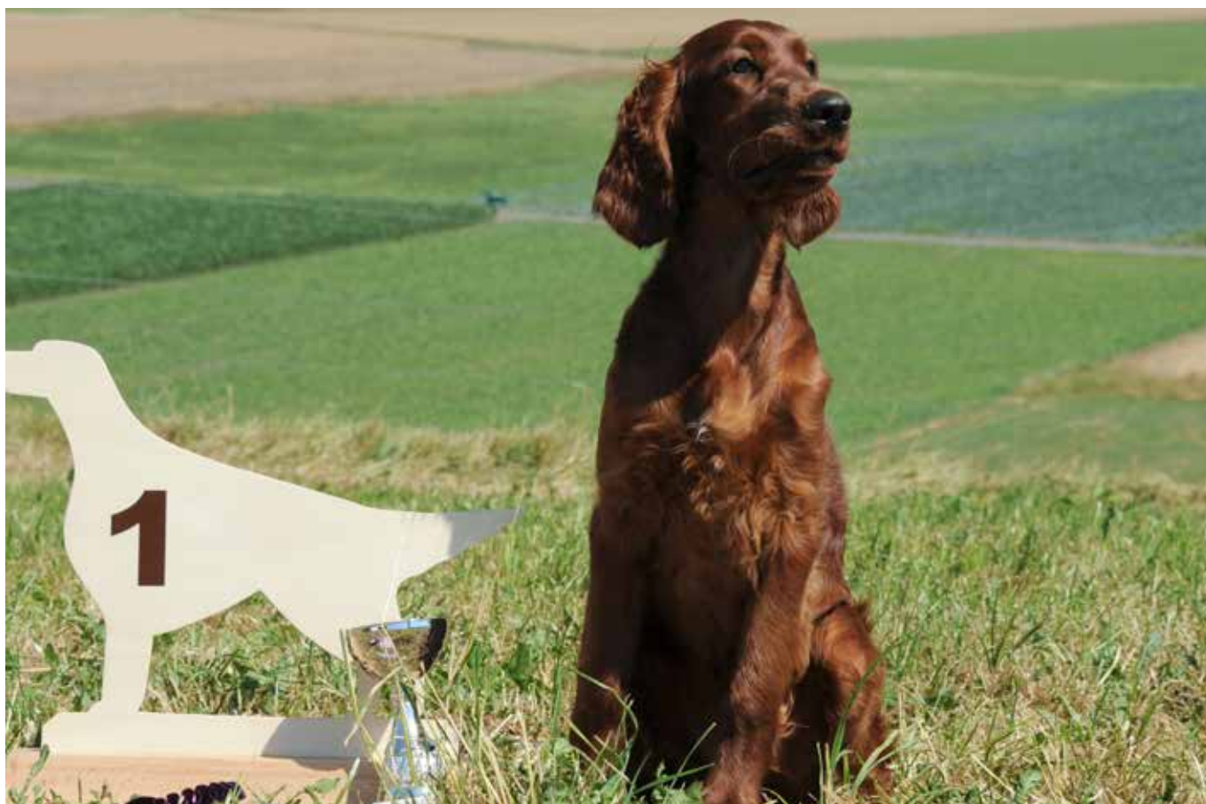
Tagessieger Babyklasse Eye Catcher Spirit of Indian Summer