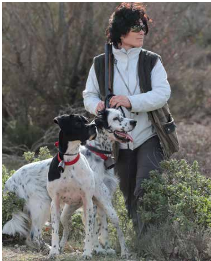
Isis de l'Escalayole & Cyrano du Tourbillon blanc