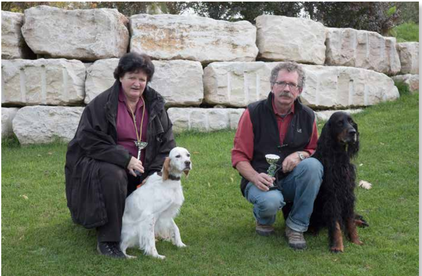
Sieger Herbstprüfung 2017, Apport I Prüfung