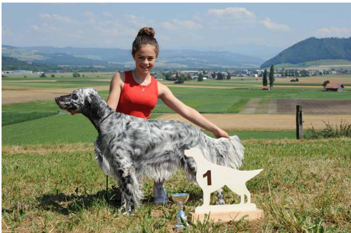
Tagessieger Jugendklasse Fairray Lavender Blue Summer Love