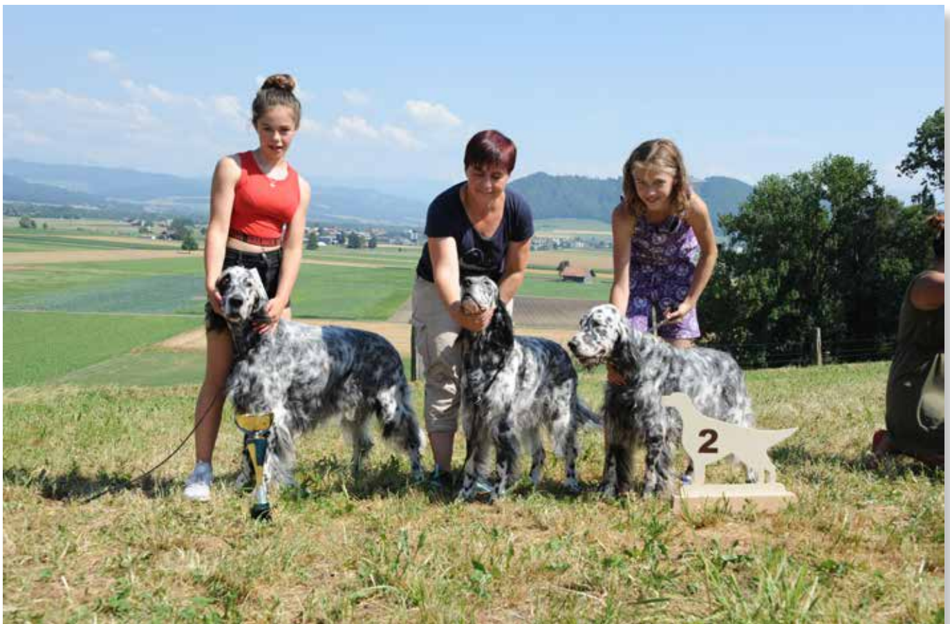
Zuchtgruppe 2. Rang