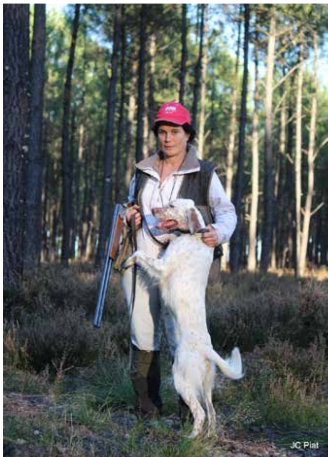
St Hubertus Weltmeisterin 2017, Duchesse du Tourbillon blanc