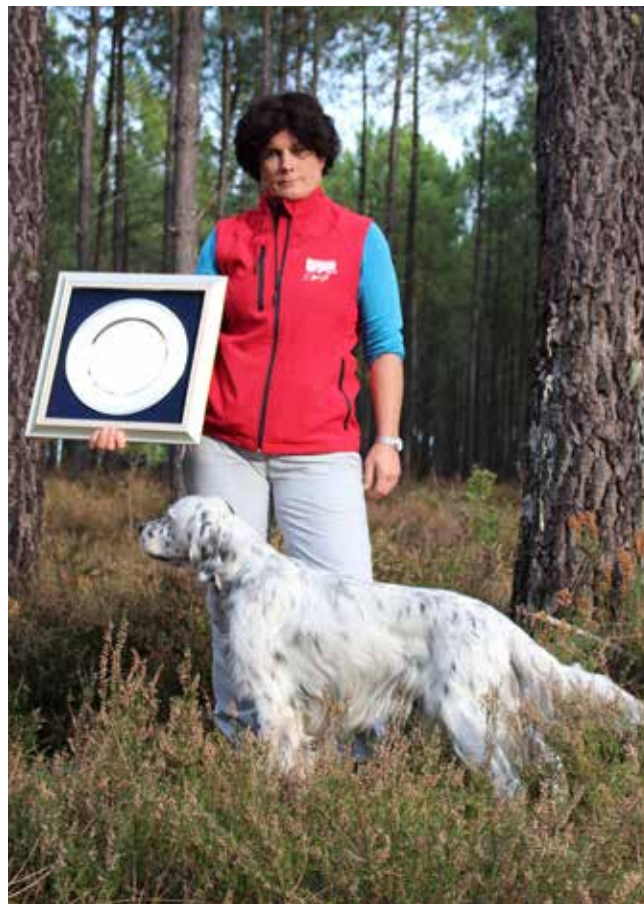
Europameister Setter GT 2017, Cyrano du Tourbillon blanc