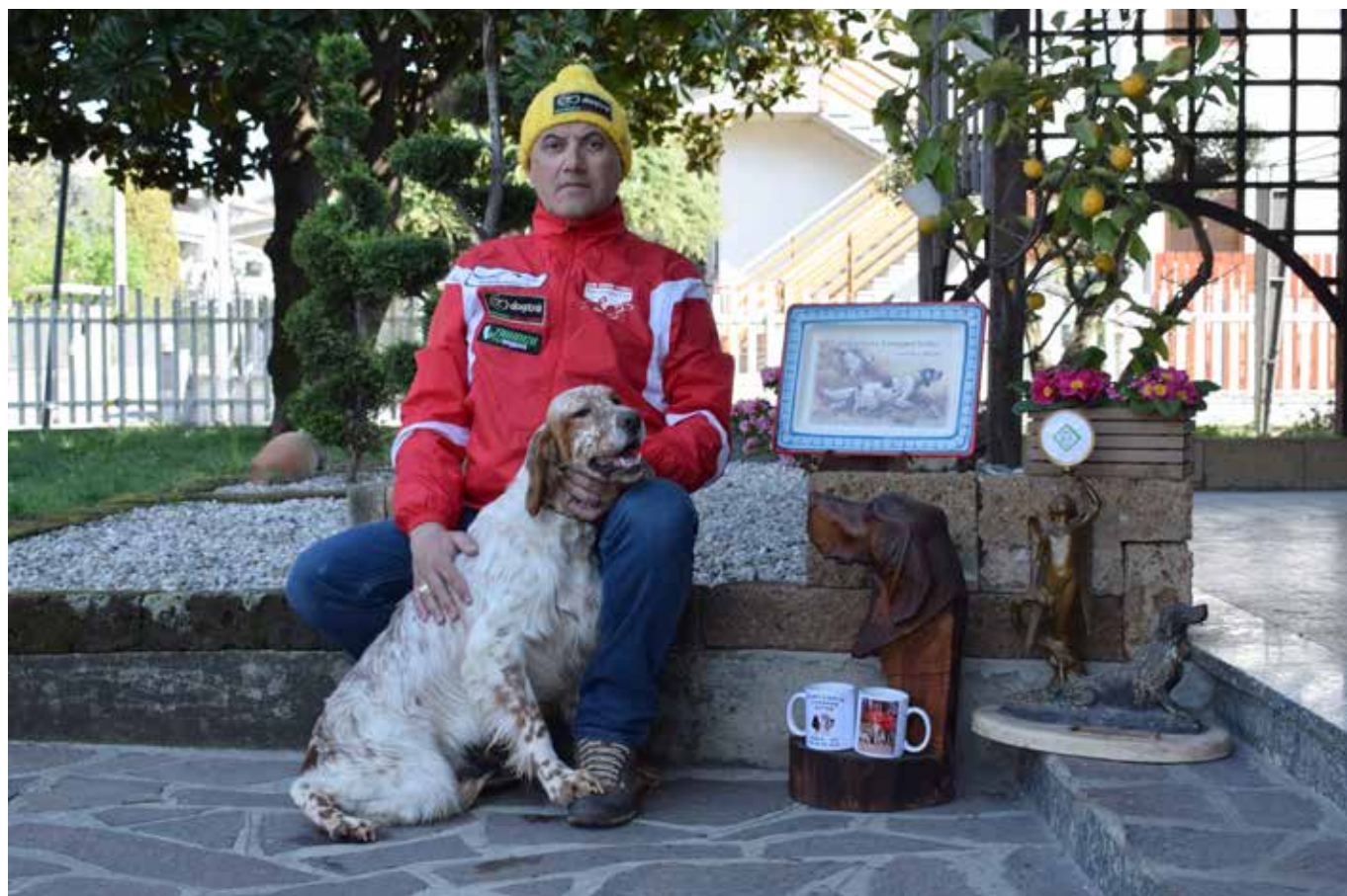
Vize Europameister FT 2017, Ciop del Zagnis