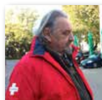
Gast Regionalgruppe Tessin

Rütigässli 23, 3800 Matten Mobile +41 79 690 4062 e-mail: trixaemmer@me.com