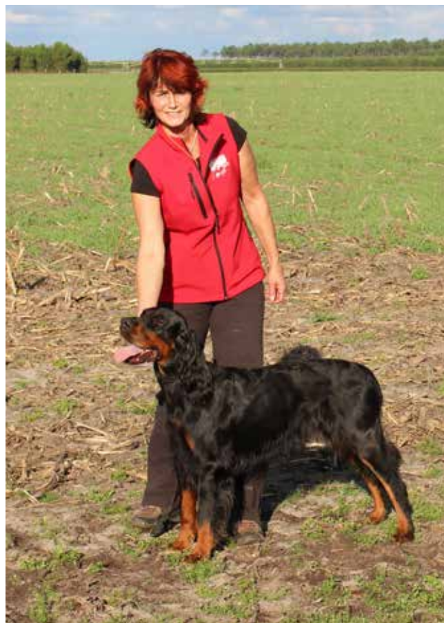
Vizeuropameisterin GT 2017, Fillies Gordon English Beauty