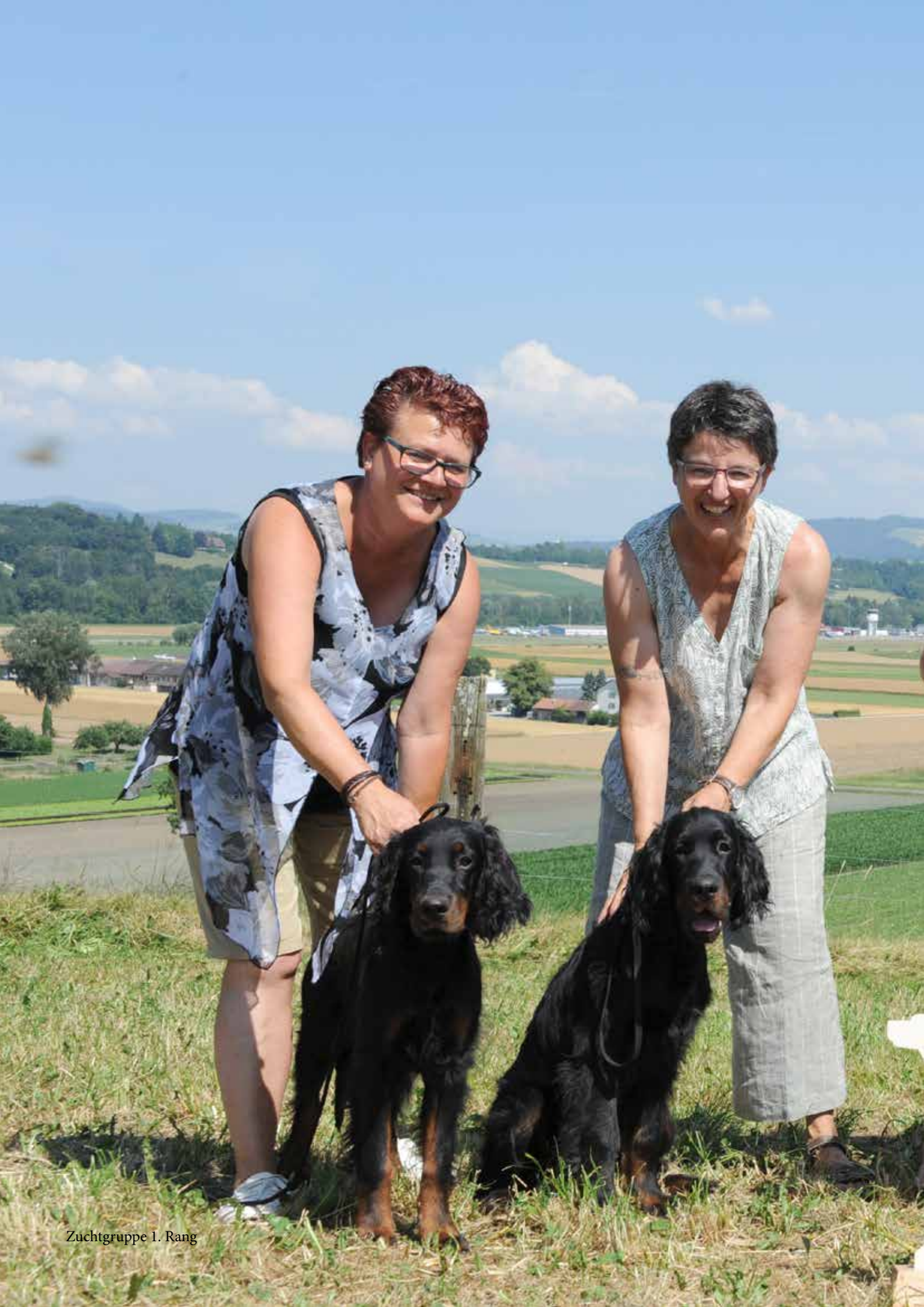
Zuchtgruppe 1. Rang